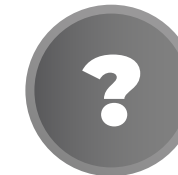
AÚN NO SABE