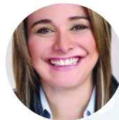
MARÍA EUGENIA CAMPOS GALVÁN