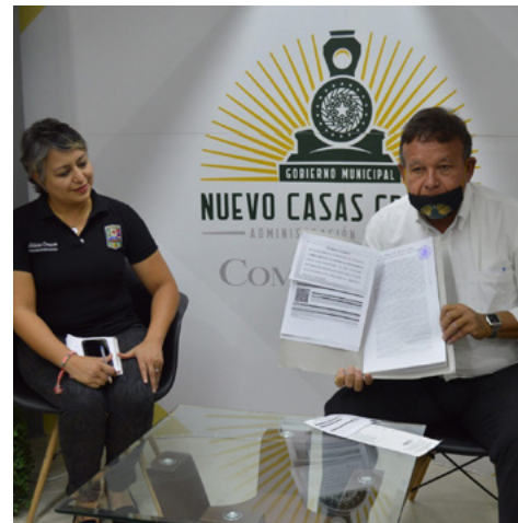
PRESENTA ALCALDE escrituras del estadio Luis Cobos Huerta

Recordó el Presidente Municipal que en mayo de 1968 ocurrió un incendio en lo que en ese entonces era el estadio de béisbol municipal, y que ahora alberga el Estadio de Fútbol Revolución. Añadió que a partir de este incendio, surgió una evidente necesidad de construir un nuevo estadio de béisbol